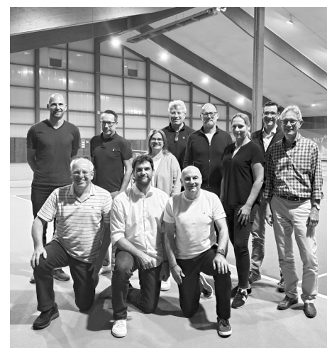
Der TC Rot-Gold Alzenau stellt sich neu auf. Erweiterter Vorstand, Vorstands-Beisitzer und Geschäftsstelle.

Mehr Information zum Tennis-Club Rot-Gold Alzenau e. V. Internet: tennis-alzenau.de Instagram: tcrotgold_alzenau Facebook: TC Rot-Gold Alzenau e.V.