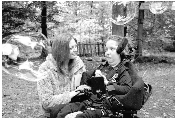
Lebensverkürzt erkranktes Kind mit ehrenamtlicher Mitarbeiterin des ambulanten Kinder- und Jugendhospizdienstes Aschaffenburg

Die digitale Einladung mit Zugangslink wird anschließend per E Mail zugesandt.