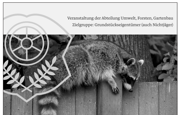
Veranstaltung der Abteilung Umwelt, Forsten, Gartenbau Zielgruppe: Grundstückseigentümer (auch Nichtjäger)